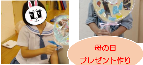
母の日 プレゼント作り