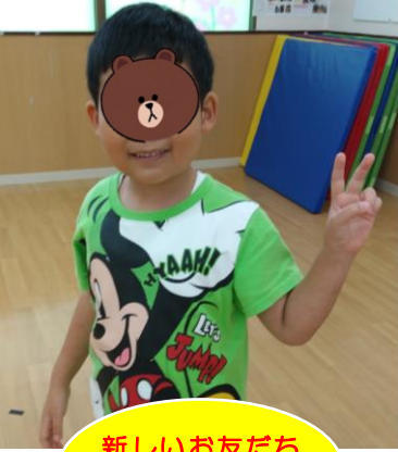
新しいお友だち です！(^o^)