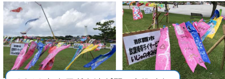
2019年も子ども達が願いを込めた こいのぼりが泳いでいましたよ(^o^)