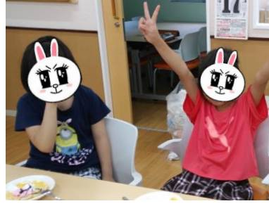
みんなで おやつ おいしいね(*^_^*)